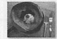
ダッチベイビーアイス