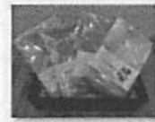
「絞り染め」ハンドタオル