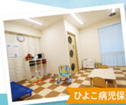
ひよこ病児保育室