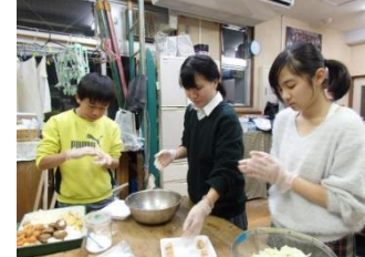
「ひがじ食堂」で ちゃんこ鍋