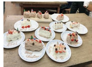
「パティスリーひがじ」で ブッシュドノエル