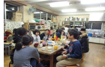
年忘れパーティー