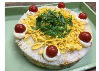
デコレーション寿司を 作りました!