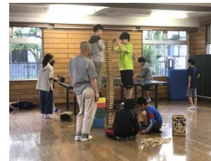
フリータイムでは 自由に遊んだり、料理押ししたり…