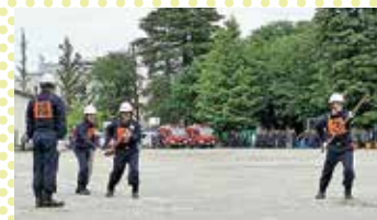
消防ポンプ車操法審査会