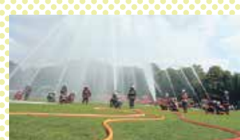
北多摩地区消防大会