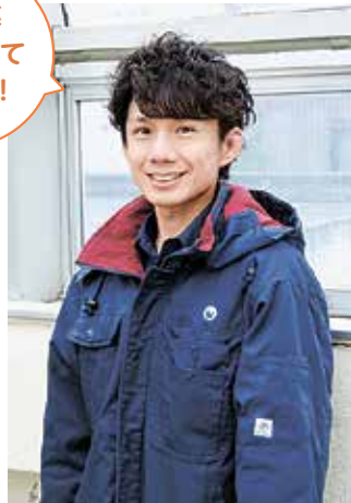
地域安全課・安治川