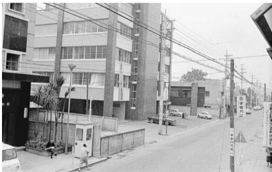
福社会館(昭和43年ごろ)

昭和43年に竣工以来、多くの方にご利用いただいていた福社会館は、耐震上の理由から、3月31日をもって閉館します。これまで実施してきた各事業等については、右表のと通りの取り扱いとなります。ご利用いただいていた市民の皆さんにはご不便をおかけしますが、ご理解・ご協力をお願いします。