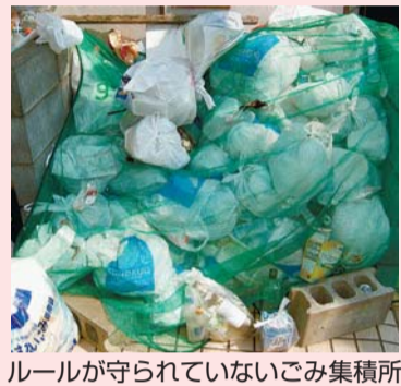
ルールが守られていないごみ集積所