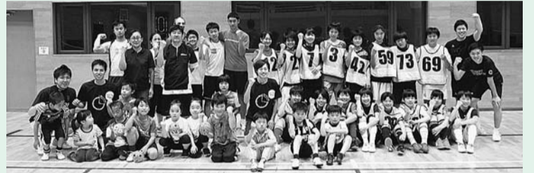
セパタクロー体験のようす