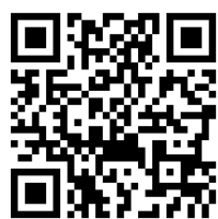
携帯サイト用 QRコード