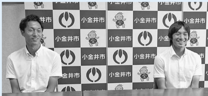
室屋選手(写真左)と中島選手