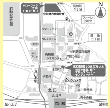
JR立川駅北口から徒歩2分です！