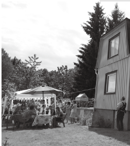
友人宅での赤ちゃんの名付けパーティー

スウェーデンは合理主義の国ですが、伝統文化や行事も大事にしています。クリスマス、イースターや祝日行事も多く、子どもの誕生日を含めてファミリーでよく集まります。ティーンエイジャーは恋人も連れてきて、親の前でも熱愛ぶりを隠しません。夫のファミリーもパーティーが多いですよ。