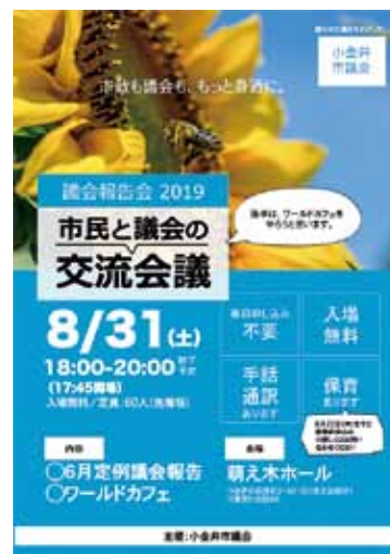
昨年開催した議会報告会

話し合いたいテーマについて、カフェのようにゆったりした雰囲気、相手の意見を尊重しながら自由に意見を述べる場です。テーブルを移動し、いろいろな人の意見を聴くこともでき、各参加者がこの対話を通じて「気付き」を得ることを目的とします。