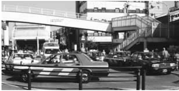
現在の武蔵小金井駅南口広場