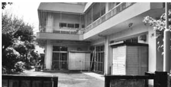
小金井の学童の障がい児受入れは10年遅れている