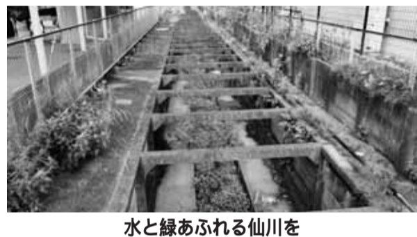
水と緑あふれる仙川を

市長 そのような基本構想と情報提供をする。その他に、待機児解消のために学芸大学での保育所設置への協力と中央線高架事業の負担金の透明化を求めました。