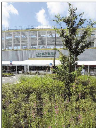
サクラとツツジ(手前はミソハギ)