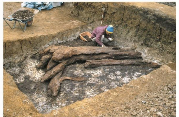
カラムツの大木の出土状況 【旧石器時代】 野川中州北遺跡

編集・発行 小金井市教育委員会 生涯学習課 平成 29 年 7 月 17 日発行