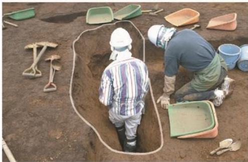
土坑(落とし穴) 【縄文時代】

(仮称)本町六丁目遺跡では、第1回遺跡見学会から1ヶ月が経ち、発掘調査が進みました。縄文時代の調査からは、落とし穴がさらに増えて狩猟エリアの様相を呈してきました。旧石器時代では炭化物の出土やこの時代の遺跡では珍しい倒木痕(とうぼくこん)が発見されています。