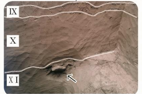
旧石器時代の石器？自然の石？ XI(11)層中から出土しました