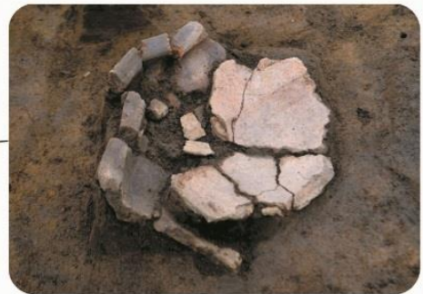
縄文土器の出土状況 土器が重なって出土した様子