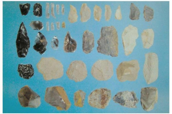
旧石器時代の石器 新橋遺跡出土