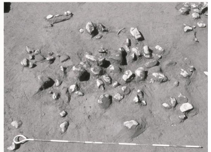
礫群（れきぐん）の検出状況 【旧石器時代】 荒牧遺跡