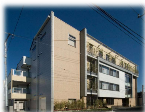
【多機能型事業所うてな】