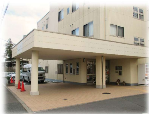
【ミアヘルサ小規模多機能ホーム小金井】