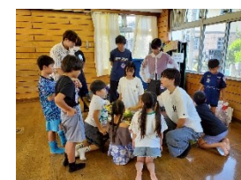
イベントのボランティア としても活躍!!