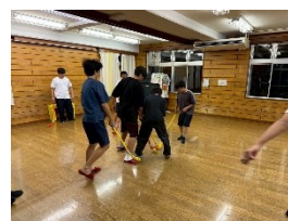
フリータイムの日は 自由に遊んでいます