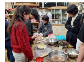
チョコパイを作ったよ!!