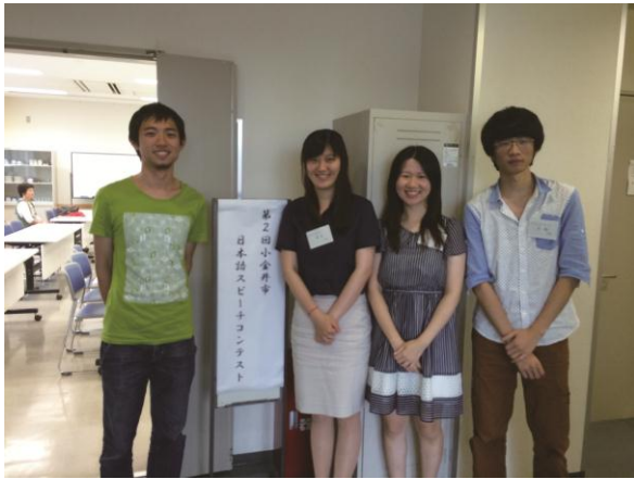
日本語教室からの参加者