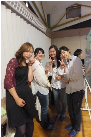
もうすぐ出番 でばん