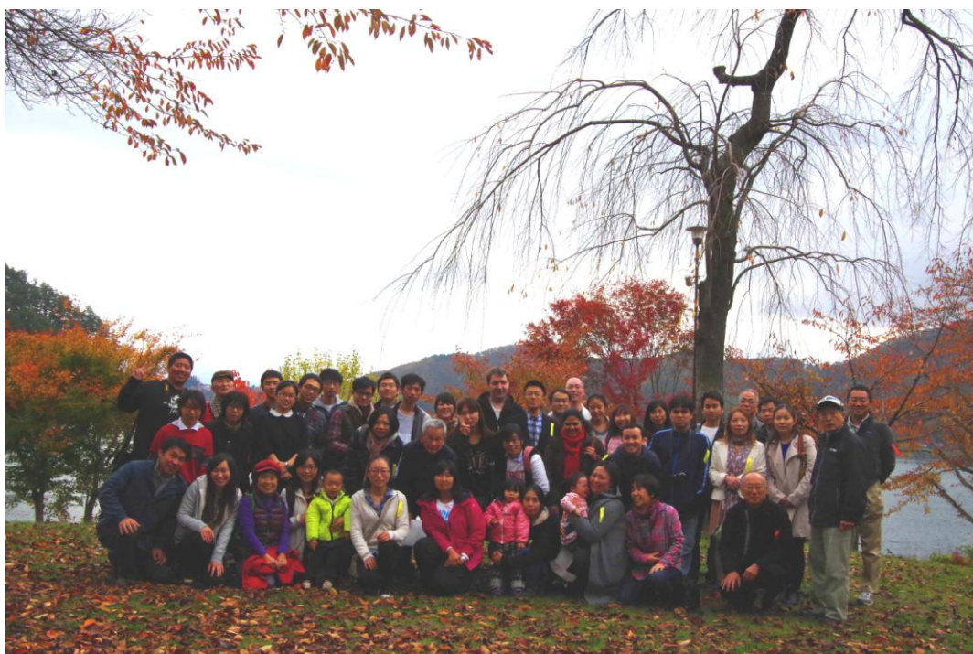
紅葉がとてもきれい

今年は紅葉が遅れ、この日はベスト。ロープウェイは1時間待ちで、急遽モーターボートに乗ることになりました。