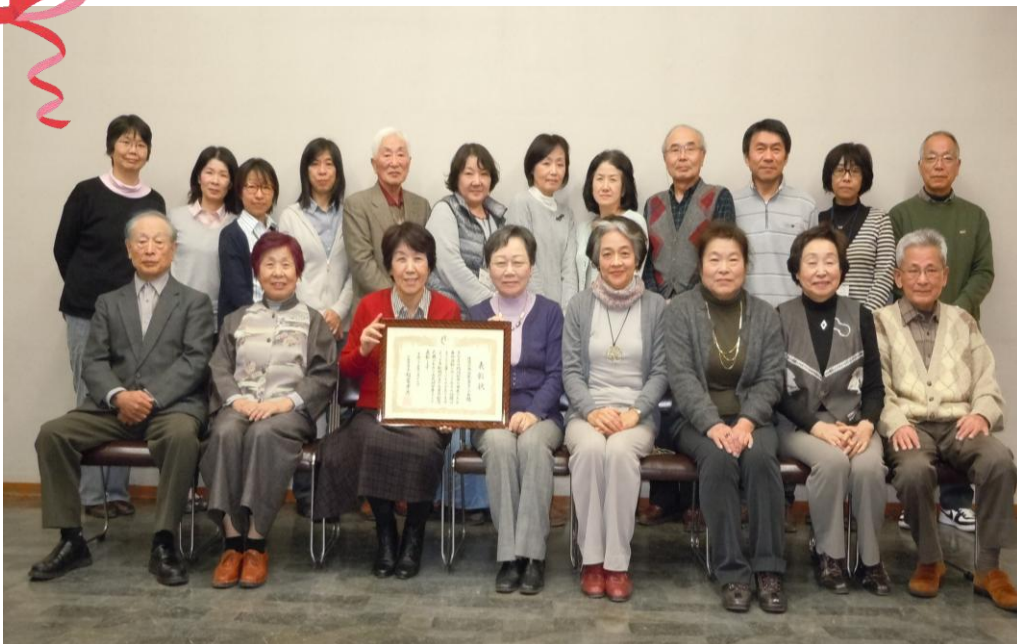
よろこ 喜びの記念撮影 きねんきつえい