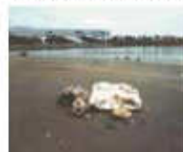
← 凍結した オイルボール

油を下水道に流すと下水道管で冷えて固まり、つまりや悪臭の原因になります。また、大雨が降ったとき、固まった油は、はがれてオイルボールとなり、川や海に流出し、水環境を汚してしまうことがあります。