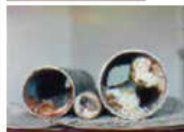
▼ 管内排水管の 閉塞状況