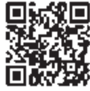
携帯サイト用QRコード

担となります。ホームページURL http://fishbowlindex.net/koganei/