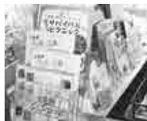
1階の情報発信コーナー