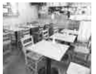
2階の飲食スペース