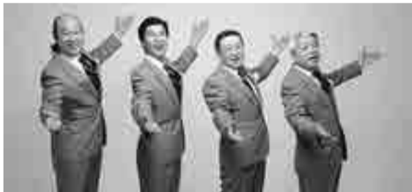
デュークエイセス