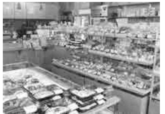
2階の飲食スペース