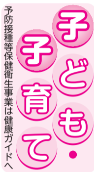
予防接種等保健衛生事業は健康ガイドへ

次のような場合には、ご連絡ください。▽振込日以降、7日を過ぎても振り込まれない場合▽氏名、住所、口座を変更した場合▽施設に入所した場合(2)