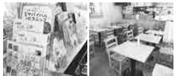
1階の情報発信コーナー