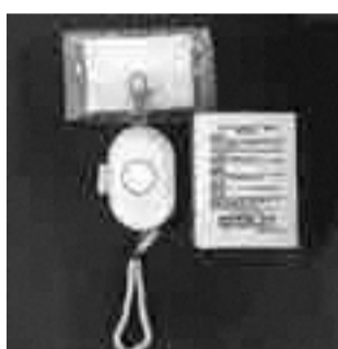
防犯ブザー (小学生用)

■配布市立小・中学校の新1年生は各学校で(申し込み不要)、市立小・中学校以外の新1年生は、学務課(市役所第二庁舎7階)で無料(電池交換等実費) ■4月6日から、直接、学務課学務係(☎042-387-9874)へ