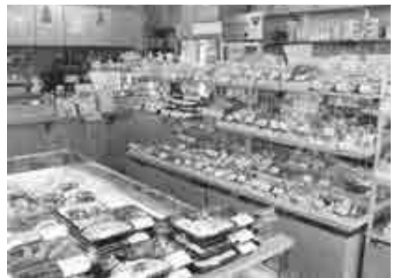
2階の飲食スペース