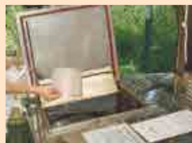
生ごみ処理機への投入のようす