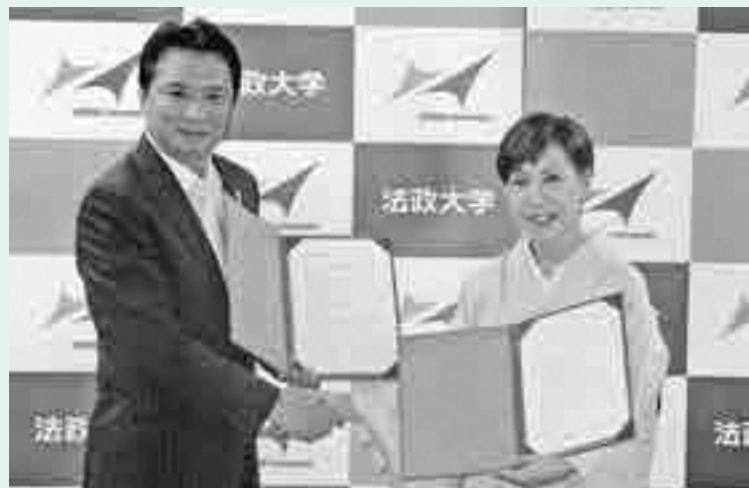
法政大学田中総長(右)と市長