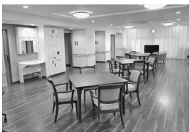
共同生活スペース