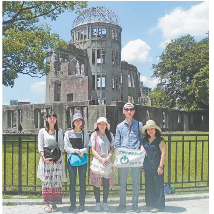
昨年の旅のようす

申 5月15日までに、電話または直接、広報秘書課広聴係(市役所第二庁舎1階 ☎042-387-9818)へ