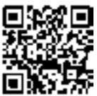
携帯サイト用QRコード