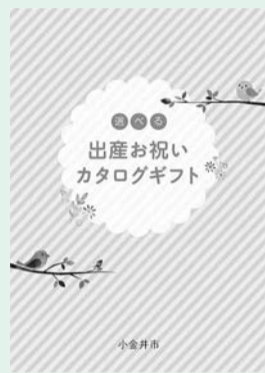
今年度のお祝いの品（カタログギフト）