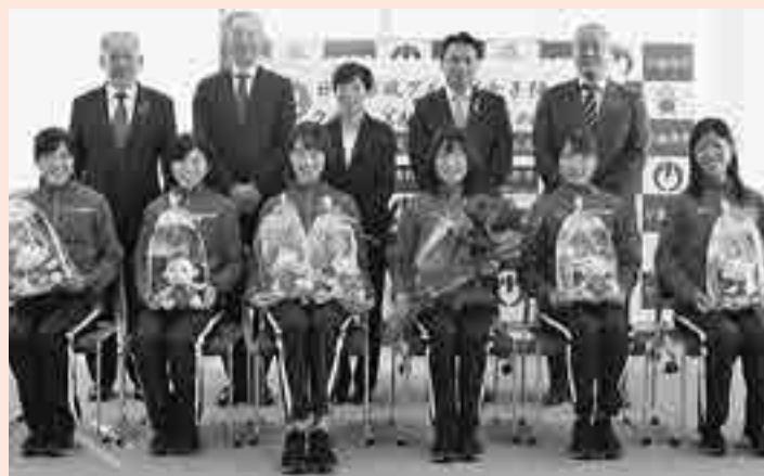
(写真後列左から時計回り) 教育長、高橋監督、齋藤コーチ、市長、副市長、廣中選手(1区)、菅田選手(2区)、鍋島選手(3区)、宇都宮選手(4区)、鈴木選手(5区)、大西選手(6区)