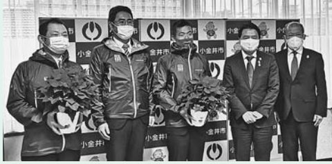
令和2年11月27日の寄贈式の様子

地域の農を身近に感じてもらう花育事業の一環として、市立小学校9校の全クラスに市内産ポインセチアの鉢花をいただきました。