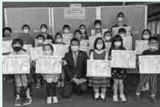
受賞した19人の子どもと市長

「小金井市のみどりをみらいへつなごう」をテーマに、絵を募集したところ、多数の応募がありました。11月21日に、表彰状の授与式を行いました。