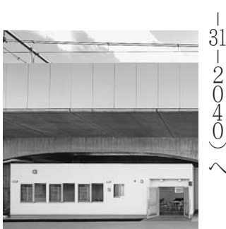
※感染症拡大防止のため、傍聴については事前にお問い合わせください

参加費助成も行っています。令和4年3月1日現在、市内615事業所、千204の方が会員として加入しています。 ■対 市内の事業所に勤務する勤労者と事業主、市内に居住し、市外の中小企業に勤務する勤労者 ■¥ 500円(月額) ■問 勤労者福祉サービスセンター (☎042-387-2525)