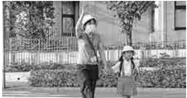
入会手続にお越しください

対市内在住で60歳以上の健康で働く意欲があり、シルバー人材センターの趣旨に賛同していただけの方 定各回20人(当日先着順) 持筆記用具、健康保険証等の本人確認書類、年会費2千円 申原則毎月第2木曜日(祝日の場合は第1木曜日)午後1時まで(本町作業所(本町6-5-16)で開催する入会説明会・