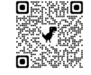
事業ホームページ

時午前10時～午後5時(荒天中止)※当日の開催状況等詳細については、同事業ホームページをご覧ください。対18歳未満の児童と保護者同開催状況、行事内容についてNPO法人こがねい子ども遊パーク☎080-6880-9809(月曜～日曜日・休場日を除く)午前10時～午後5時、事業について児童青少年課児童青少年係☎042-387-9847