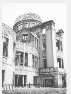
原爆ドーム(広島市)