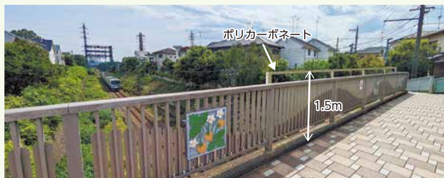
ポリカーボネートの設置イメージ