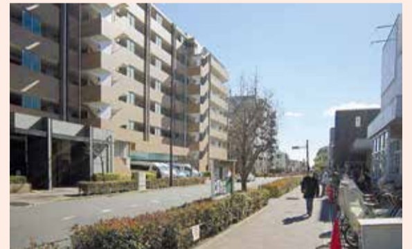
緑中央通り 無電柱化後(イメージ)