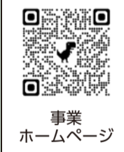
事業ホームページ

www.koganei-yu.net/playpark(ark)をご覧ください。お問い合わせください。NPO法人こがねい子ども遊パーク(☎080-6880-9809)月曜・日曜日・休場日を除く午前10時~午後5時、プレーパーク事業について児童青少年課児童青少年係(☎042-387-9847)