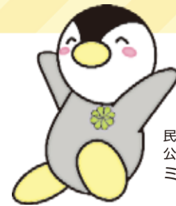
民生委員・児童委員の 公式イメージキャラクター ミンジー