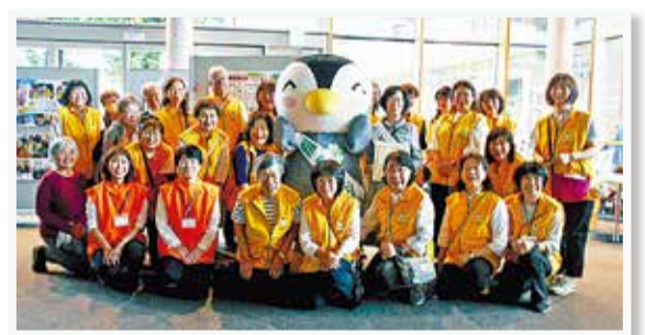
昨年度のPR委員会のようす