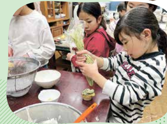
低学年グループの活動

緑小学校や緑中学校のすぐ近くにあり、緑小学校や第三小学校の子どもたちが多く遊びに来ています! 遊戯室で球技をしたり、みんなでゲームをして毎日賑やかです。また、乳幼児対象の子育てひろばには、たくさんの親子が遊びに来ています。月に1回、中・高校生世代対象に夜間開館を実施していて、中学生や高校生世代も遊べます。緑児童館では、さまざまな世代が利用しています。