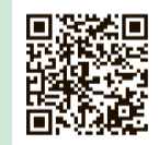
図 ごみ対策課減量推進係 (☎042-387-9854)

店舗ごとで回収方法は異なりますが、右記掲載の二次元コードでご確認のうえ、「家庭の油で飛行機を飛ばす」この取り組みにぜひ、ご協力ください。