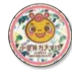
小・全井カメすけ 協力店ステッカー

令和4年10月から、(くるカメ)食品ロス削減プロジェクトとして、食品ロス削減推進協力店・事業所に認定された店舗の中で、さらにご協力いただけるお店について、食品ロスの削減を目的としたマッチングサービス「小金井カメすけ」を開始しています。 市内のお店が売れ残りそうな食品や規格外品などをWEBサイト「タベスケ」に値引きして出品し、利用者がお得に購入できるサービスです。