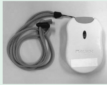
無線発報器（ペンダント式）

等の単品給付もあります。 対 ひとり暮らしまたは高齢者世帯（日中のみひとりの方も可）で、救急車を呼ぶような慢性疾患等のため常時注意を要する方