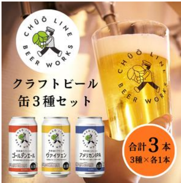
中央線ビアワークスクラフトビール3缶セット (350ミリリットル×3本)

小金井市のふるさと納税について、地場産品の振興に資するため、新たな返礼品を出品いたしました