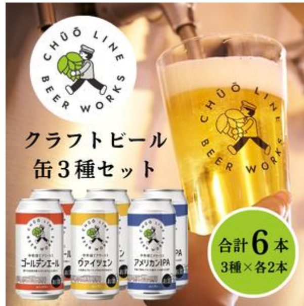
中央線ビアワークスクラフトビール6缶セット (350ミリリットル×6本)