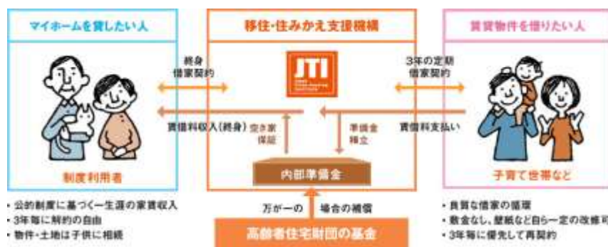
図：一般社団法人 移住・住みかえ支援機構（JTI）HPより

マイホーム借上げ制度 住みかえを希望しているシニア（50歳以上）のマイホームを借上げ、それを子育て世代を中心に転貸します。シニア世代は、自宅を売却することなく住みかえや老後の資金として活用することができ、子育て世代は、広い一軒家等の良質な住宅に入居することができます。