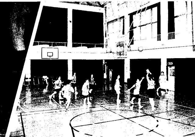
市民体育祭で活躍のみなさん