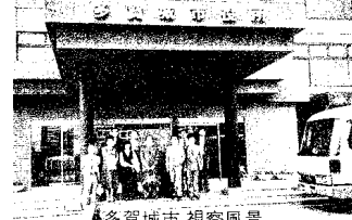
多賀城市 視察風景

厚生文教委員会 7月11・12日 〈視察先及び視察項目〉 富山県富山市 ○生涯学習について 石川県金沢市 ○福祉サービス公社について ○障壁のない身障者、高齢者にやさしい生活空間について 〈視察成果〉 富山市では、全国有数の生涯学習の先進市として、市制100周年目に「生涯学習都市宣言」を行い、今年10月には第6回全国生涯学習フェスティバルのメイン会場となっている。その主体である市民大学は昭和26年に自由学校として発足し、昭和53年に市民大学となった。金沢市では、財団法人福祉サービス公社が平成2年2月に設立され、行政で補えない部分を公共性を保ちながら民間の特性を生かした有償福祉サービスを行う。また、高齢者や障害者に住みやすいく工夫されたバリアフリーハウスは、どこにも段差がなく日常生活の不便さを感じない住宅で、大変参考になった。