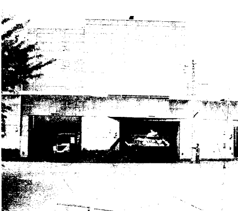
ごみ処理は、分別収集を拡大し、受益者負担で(中間処理場)

「一般廃棄物処理基本計画」が見直されると聞く。(7)見直しには欧米先進国の例に学び、分別収集の拡大に取り組みを。(8)受益者負担を原則に、ごみ処理の有料化を検討しないか。 生活環境部長 (7)ベクトル、トレイ等は、拠点回収と対策について早急に検討すべき時期にきているのでは。 建設部長 (7)駐輪場は先が見え、真剣に取り組んでいる。総合調整を、実態に合わせて進めたいようにする。 3 中間処理場火災事故を教訓に、「人命尊重」「市民優先」を原則に、全施設の管理体制を専門家も入れて見直すべきではないか。 市長 この機会に全施設について点検する。