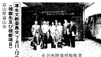
金沢市現場視察風景