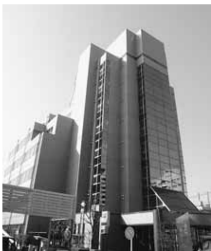
賃借状況が続く第二庁舎

②国旗掲揚、国家斉唱への対応。学校教育部長 全校で適正実施。市長 主権国家のシンボルです。市長 心の成長を促したい。