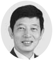
関根優司 (日本共産党)