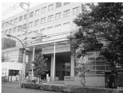
市内で大気中放射能測定値を公表している法政大学

①福島原発事故は史上初めての重大事態。日本共産党都議団が都内128か所で独自に測定した放射能値は都の公表している測定値より上回る場所が多かった。保育園の園庭・小中学校の校庭・プール・公園等の独自の調査をするべき。