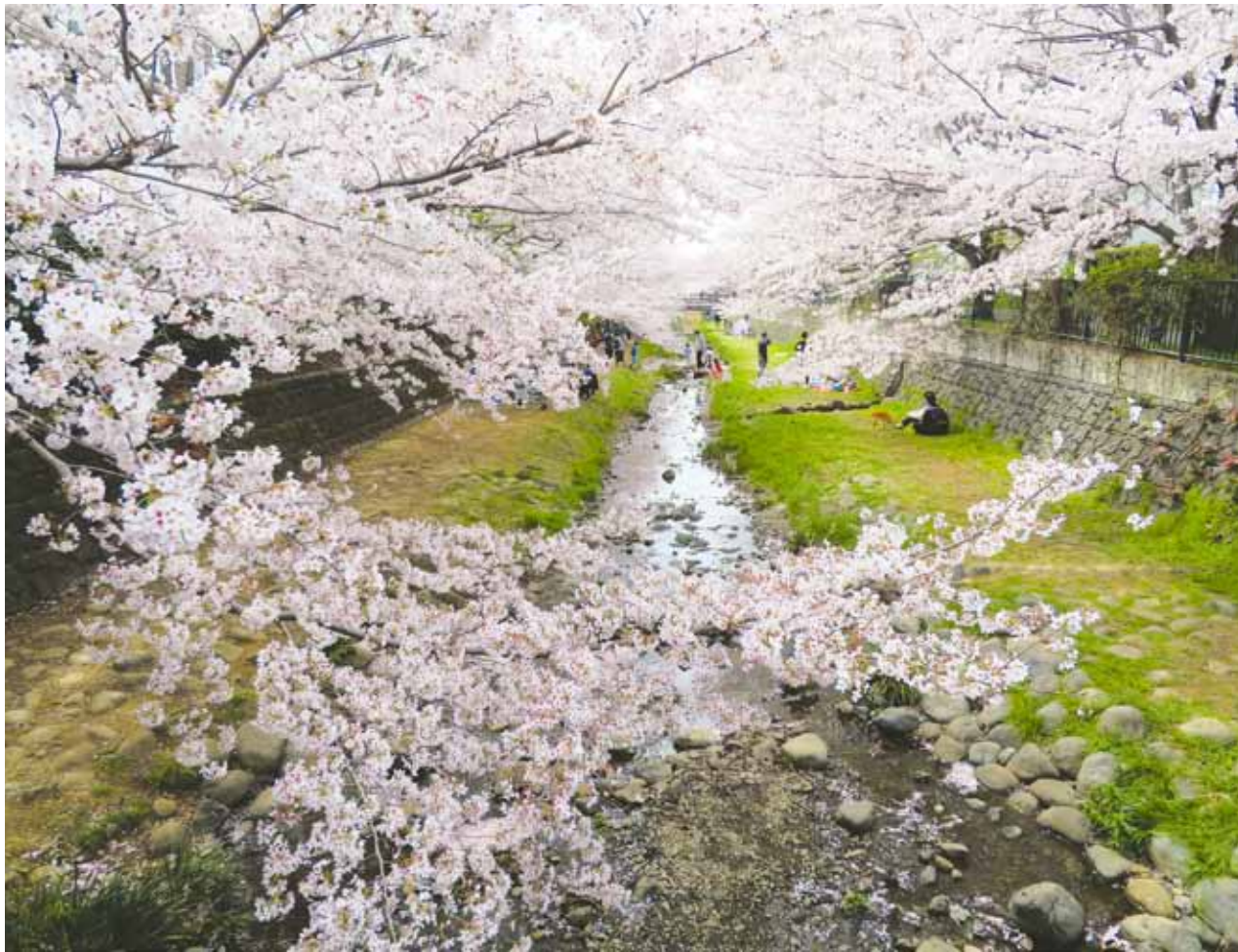
第67回小金井の四季の観光写真コンクール

感染症対策のため、傍聴席数を減らしております。定員を超えた場合は、別室で音声のみのご案内となります。また、インターネット中継・動画配信も行っております。 日時 6月5日(日) 午前10時から 内容 一般質問 その他 手話通訳を行います。 場所 議場(市役所本庁舎4階)